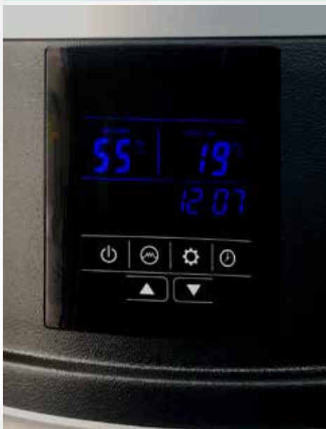
Controlador digital "Touch Screen"

Quando o contacto está fechado, o setpoint da água é aumentado para o outro valor programado, sendo que até 60°C aquece com compressor e acima disso com resistência.